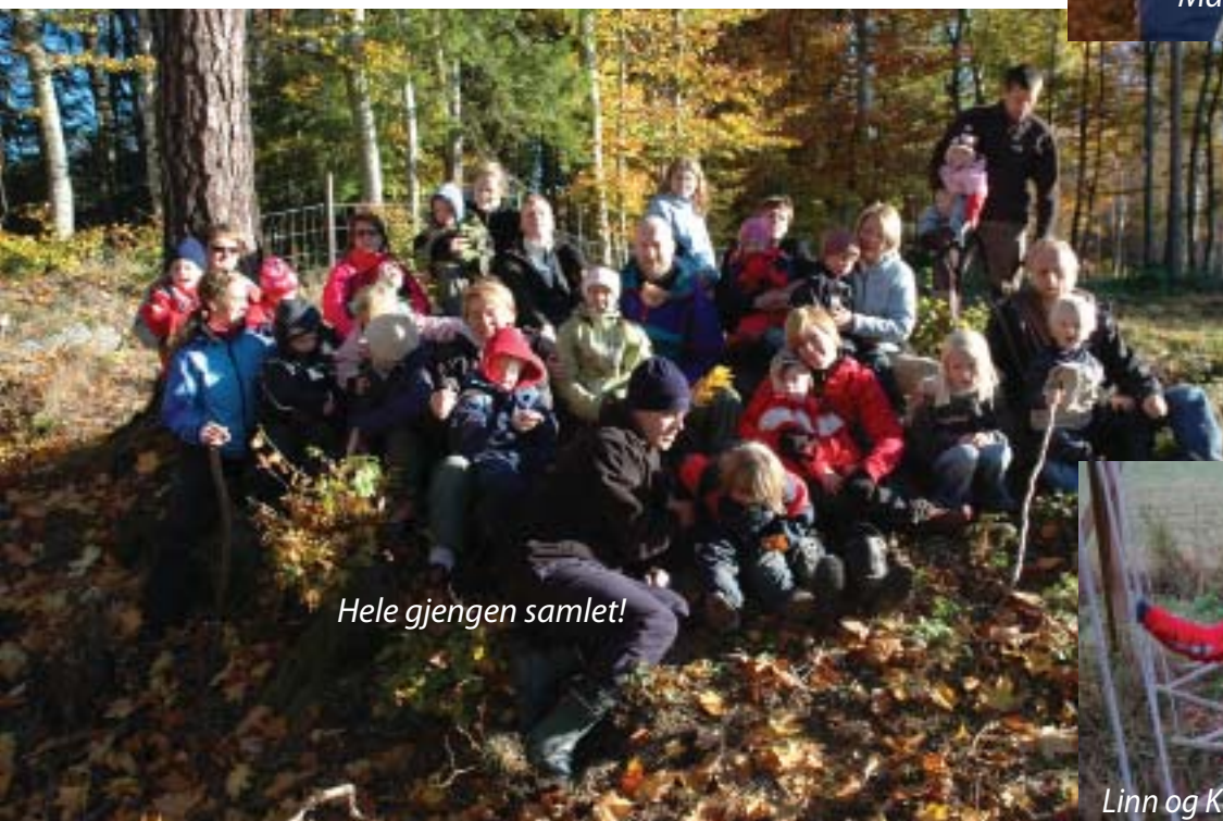
Hele gjengen samlet!