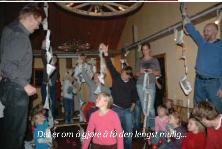
Det er om å gjøre å få den lengst mulig...