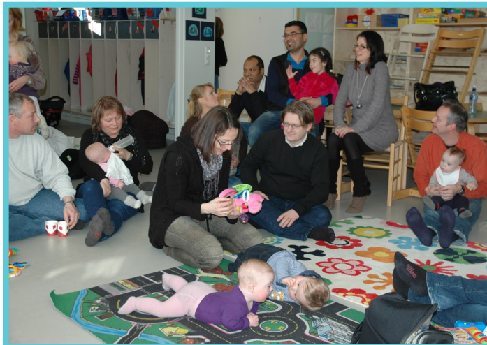
Ups & Downs Bærum opplever å få mange nye medlemmer, også fra andre kommuner enn Bærum. Veldig hyggelig! Her fra småbarnstreffet i februar i år.